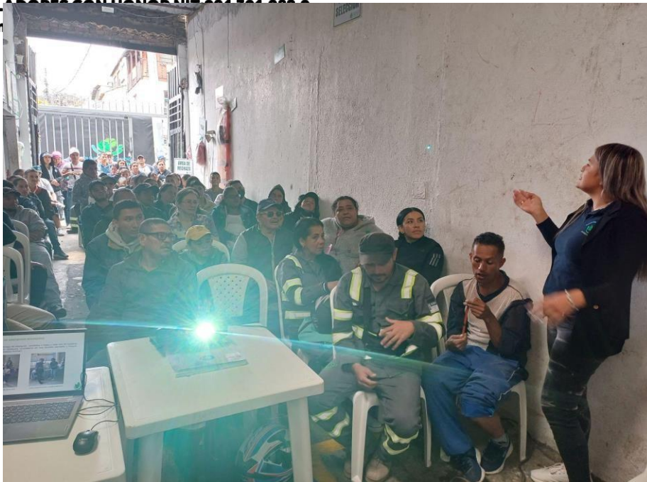
Fotografía 2. Asamblea General Ordinaria 2023.