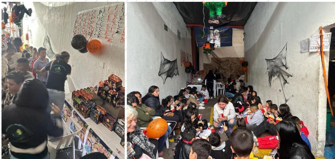
Fotografía 3. Entrega de anchetas fin de año 2023