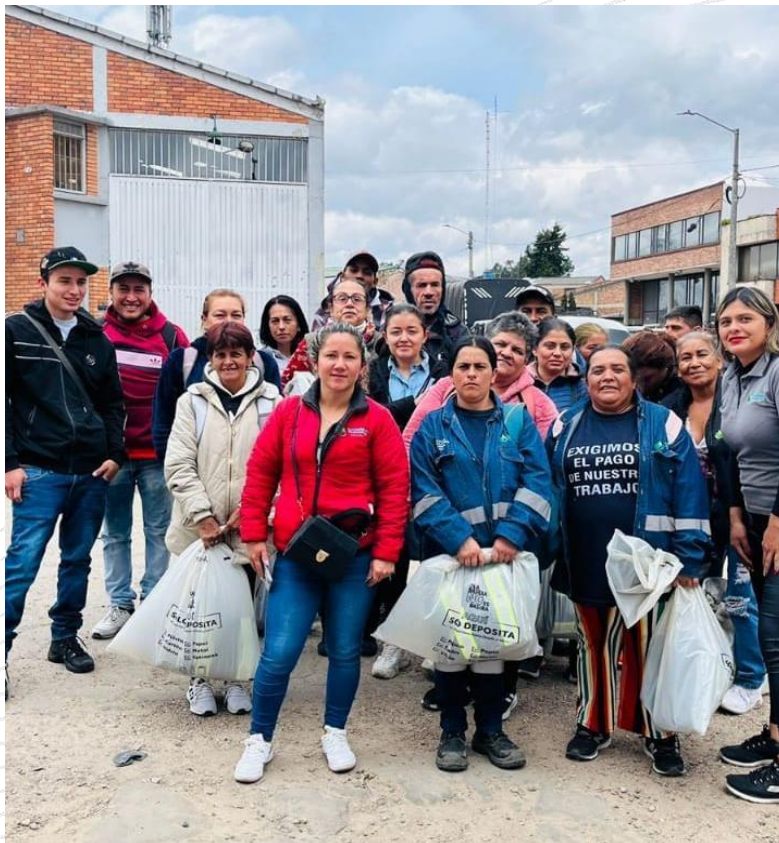
Fotografía 5. Entrega de carnets y Overoles por parte de la Unidad Administrativa de Servicios Públicos - UAESP 2023

En el mes de septiembre del año 2023, se realiza entrega de los carnets y Overoles de los recicladores de oficio por parte de la Unidad Administrativa de Servicios Públicos, la participación de la organización en estas campañas es importante para que los recicladores de oficio de la Asociación de Recicladores con Honor - ASORECOHOR estén carnetizados e identificados para la prestación del servicio público.