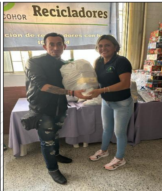
Fotografía 3. Entrega de anchetas fin de año 2023