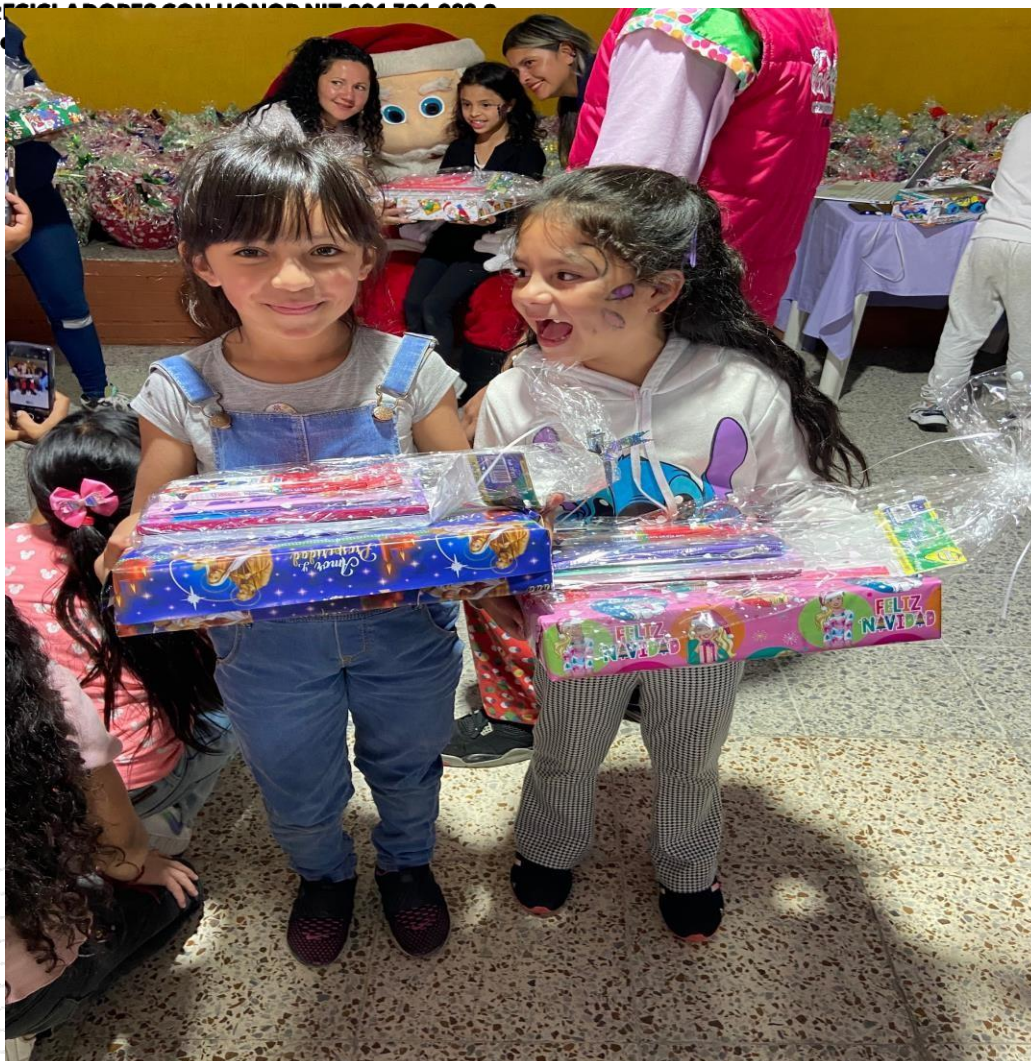
Fotografía 4. Entrega de regalos de navidad año 2023

ENTREGA DE CARNETS DE RECICLADORES DE OFICIO POR PARTE DE LA UNIDAD ADMINISTRATIVA DE SERVICIOS PÚBLICOS - UAESP