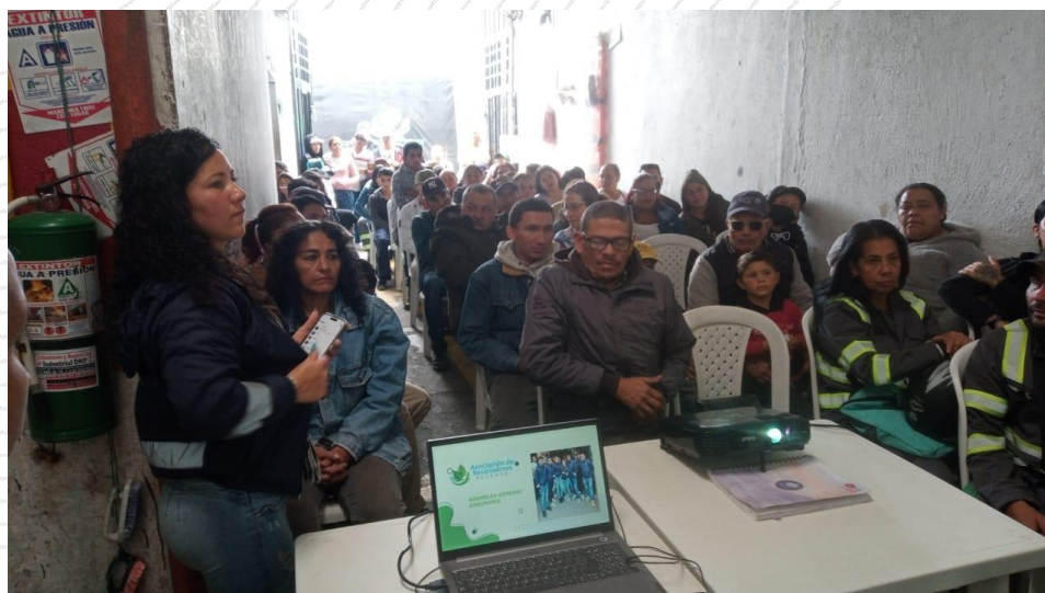
Fotografía 1. Asamblea General Ordinaria 2023.

Por otra parte, el crecimiento de la organización se refleja en que se ha fortalecido las herramientas de trabajo evidenciándose en el momento que se inicia. Al igual que el alquiler de montacargas hoy en día esto ayuda a que el flujo de material en la bodega se evacua más fácilmente al igual que el esfuerzo que deben realizar los recicladores operarios.