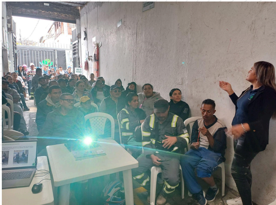
Fotografía 2. Asamblea General Ordinaria 2023.