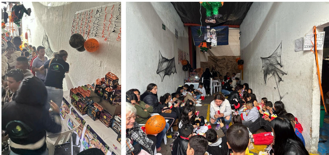
Fotografía 3. Actividad Celebración del día del niño