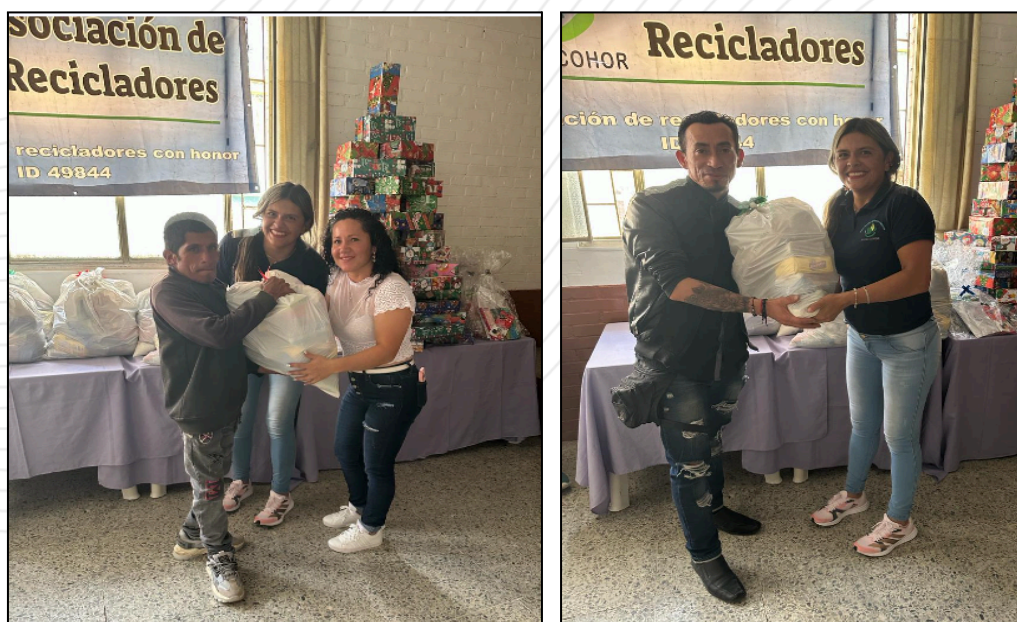
Fotografía 4. Entrega de anchetas fin de año 2023