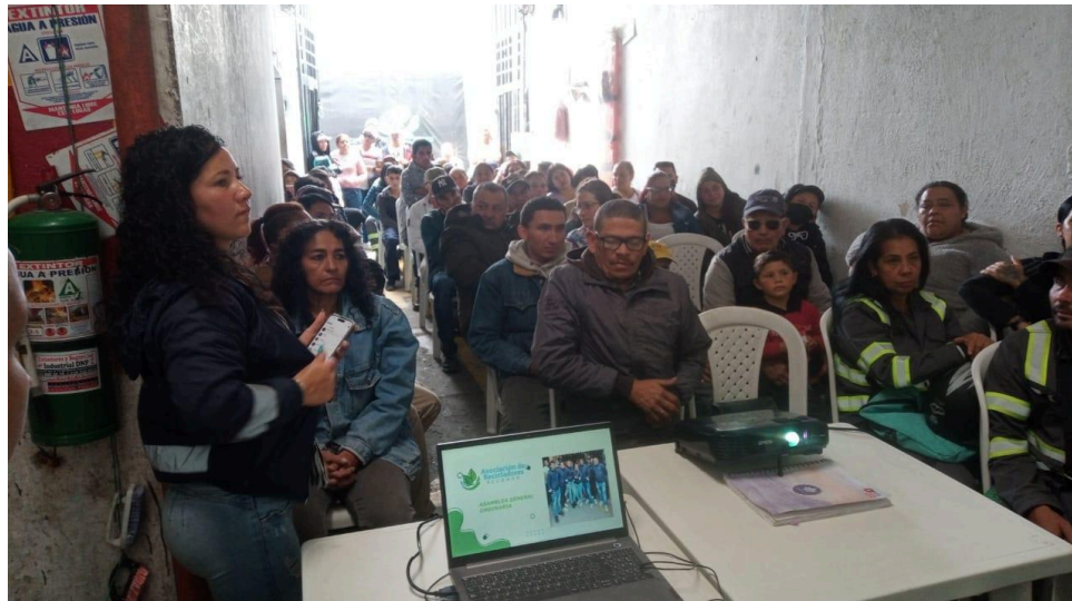
Fotografía 1. Asamblea General Ordinaria 2023.