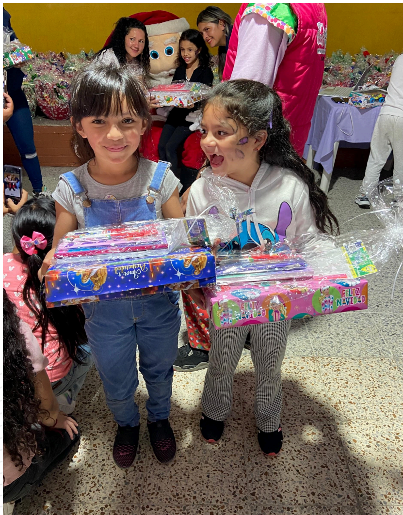
Fotografía 5. Entrega de regalos de navidad y kits escolares año 2023